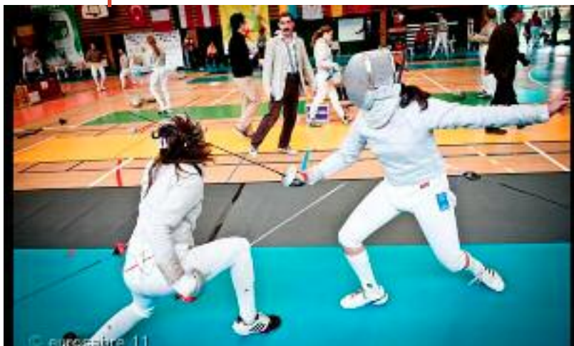
Eurosabre, coupe d'Europe Cadets organisée tous les ans par Meylan Escrime. Ici, pan sur la tête !

Alliant des qualités physiques, mentales, techniques et tactiques, ce sport favorise la concentration, la maîtrise de soi, la coordination et l'esprit d'initiative et de décision. Conversation par les armes, l'escrime est une discipline basée sur des valeurs partagées de respect des règles, de l'adversaire, de l'arbitre, d'abnégation et de courage. C'est aussi un d'équipe.